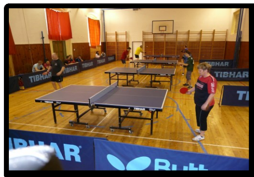
Tělocvična 2.ZŠ Sokolov