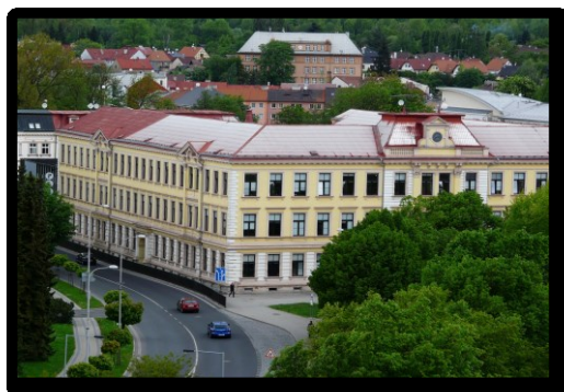
Budova 2.ZŠ Sokolov